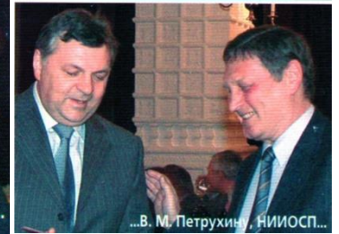
...В. М. Петрухину, НИИОСП...