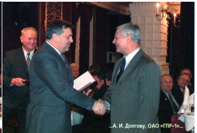
...А. И. Долгову, ОАО «ГПР-1»...